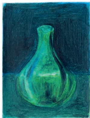
Huile sur toile, 16 x 21 cm, 2024