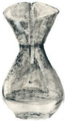
Encre et apprêt sur papier ancien, 56 x 80 cm, 2024