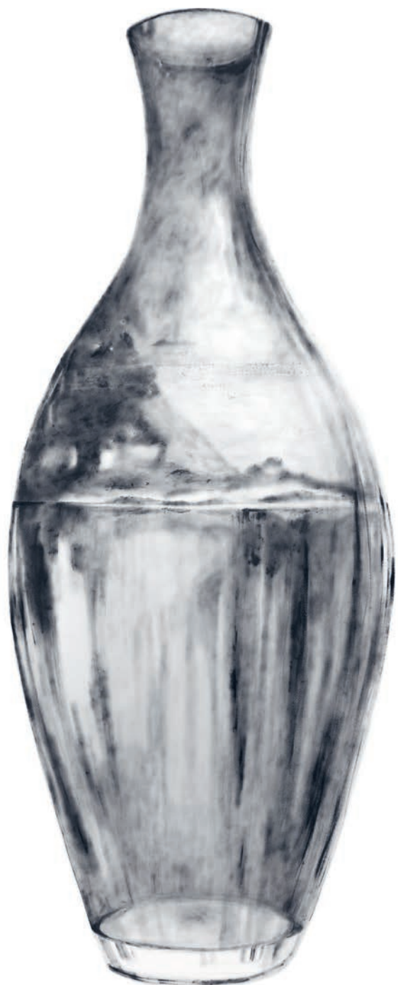
En couverture : Encre sur papier, 30 x 40 cm, 2024