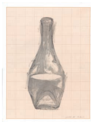
Cirage sur papier millimétré, 50 x 65 cm, 2024

« Oxymores » met en relation des contraires qui en se fréquentant s'harmonisent pour créer d'autres perspectives. Au propre comme au figuré, ils donnent l'occasion à Kiran Katara de réfléchir la lumière.