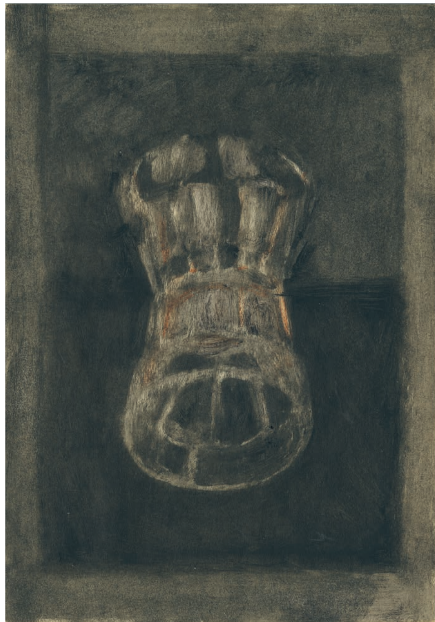
Techniques mixtes sur papier ancien, 14 x 20 cm, 2024