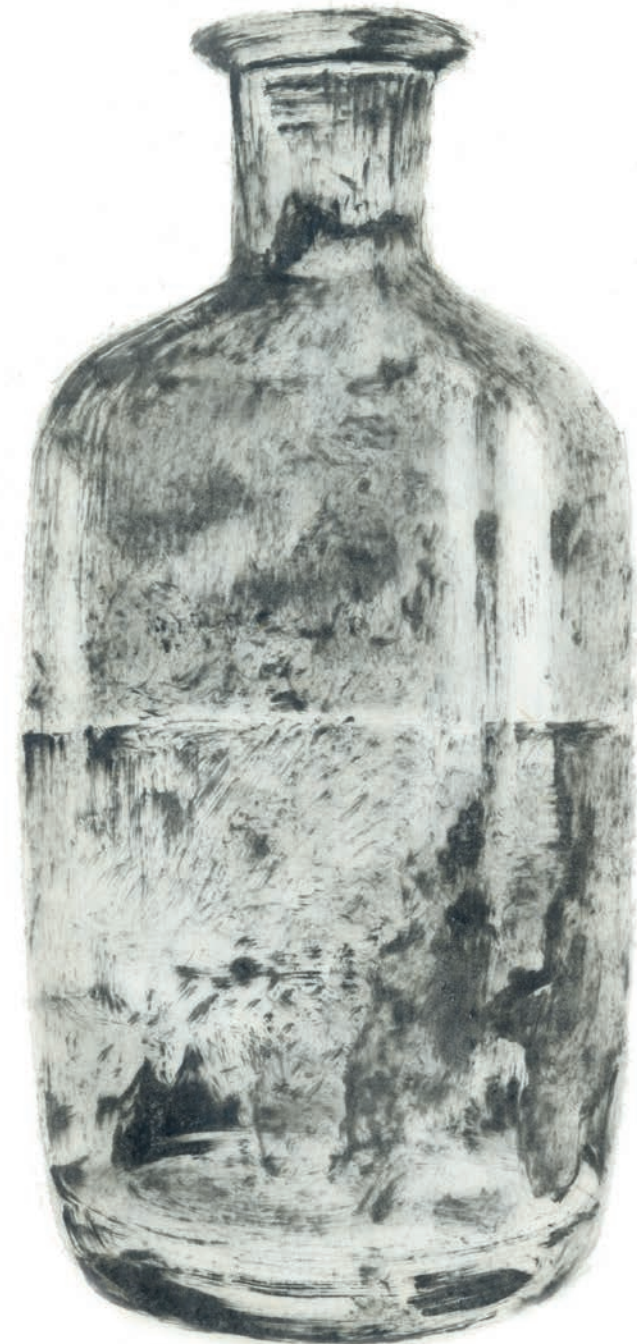
Impression sur papier, 56 x 76 cm, 2024