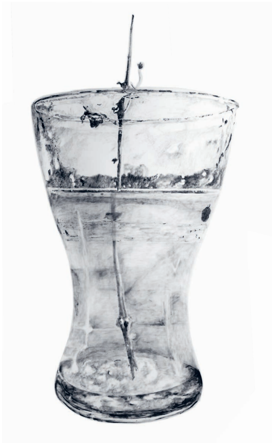
Encre sur papier 152 x 240 cm, 2024