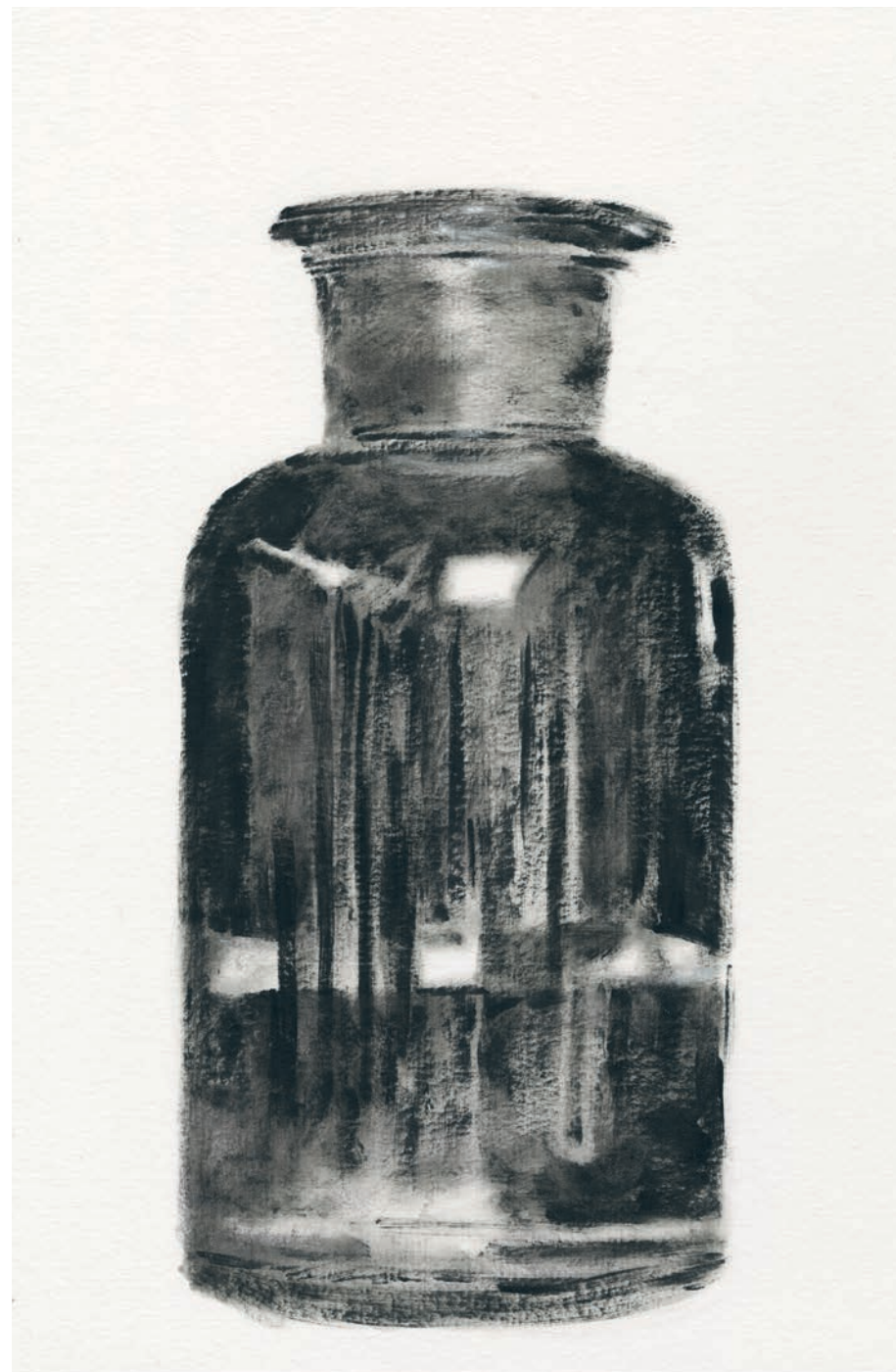
Encre sur papier, 30 x 40 cm, 2024